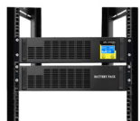
主机加一个电池包