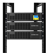
主机加两个电池包